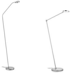
THEA-S-Flex und THEA-S 41.975.xx und 41.980.xx Stehleuchte / floor lamp 13 W LED, 2.700 K, 1700 lm, EEL-E