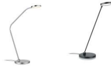
THEA-T-Flex und THEA-T 61.623.xx und 61.626.xx Tischleuchte / table lamp 13 W LED, 2.700 K, 1700 lm, EEL-E