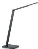
JULI-T 61.622.xx Tischleuchte / table lamp 10 W LED, 2.700 K, 1280 lm Energy efficiency class D