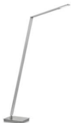
JULI-S 41.968.xx Stehleuchte / floor lamp 10 W LED, 2.700 K, 1280 lm Energieeffizienzklasse D