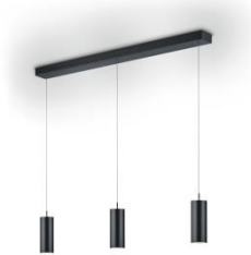
HELLI Pendant lamp 51.511.xx 6 x 8 W LED, 2.700 K, 4.280 lm, EEL-E